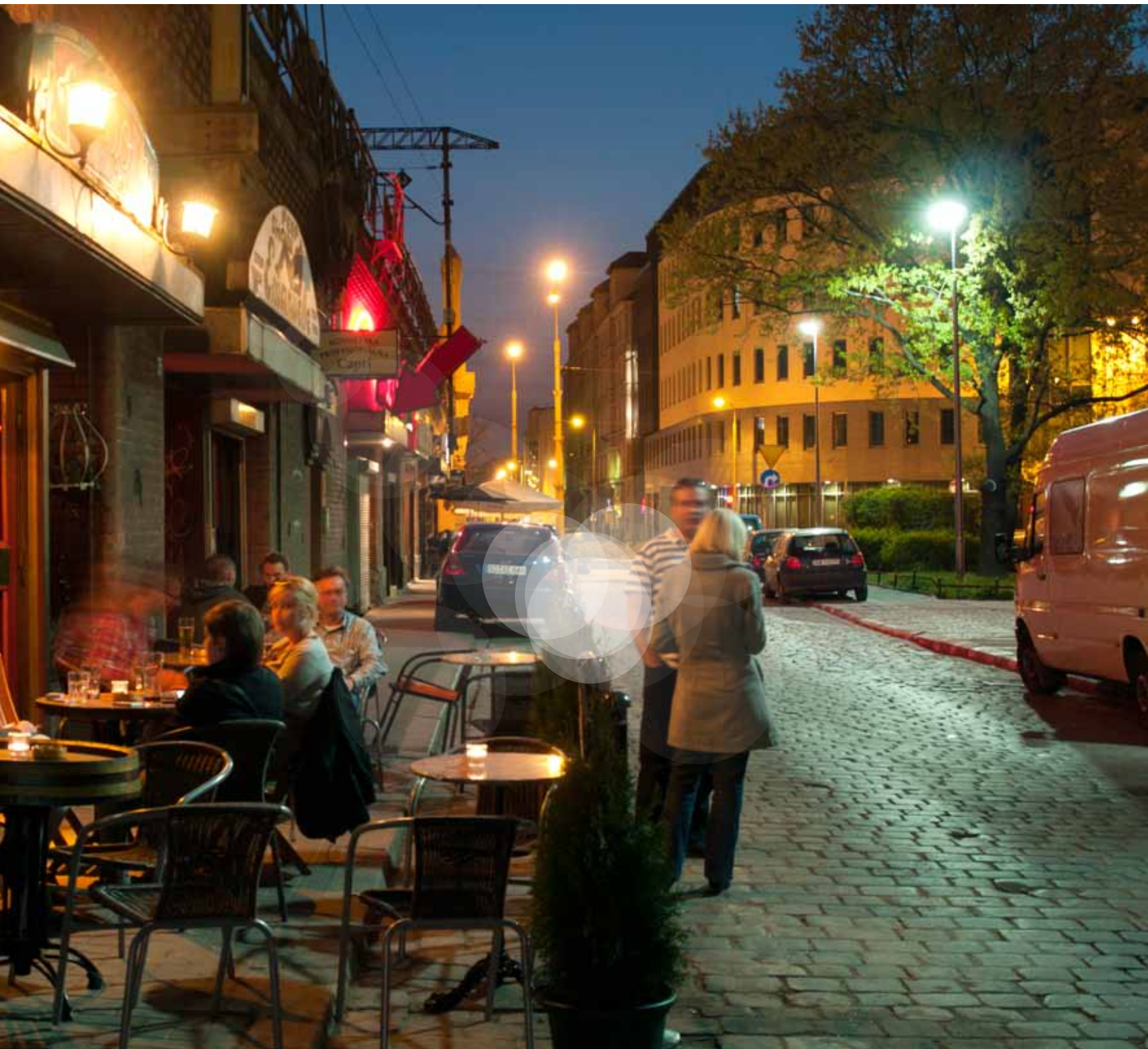
Wrocław | Polsko