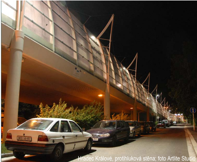
Hradec Králové, protihluková stěna

Závěrem lze tedy říci, že byly splněny všechny požadované aspekty - zlepšení osvětlení úseku komunikace, snížení světelného znečištění a všechny materiály jsou 100% recyklovatelné (hliník, sklo).