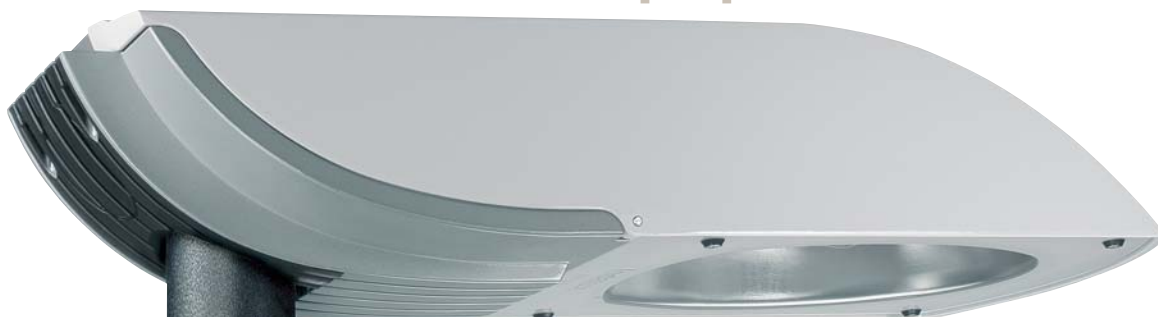
svítidlo Visual IVF

Původní koncepce osvětlení tohoto úseku veřejného osvětlení nespĺňovala nejen normy, které musí být dodrženy pro osvětlování komunikací, ale nespĺňovala ani současné požadavky na veřejné osvětlení z pohledu světelného znečištění, či recyklovatelnosti použitých materiálů (použití plastových svítidel s vypouklým difuzorem).