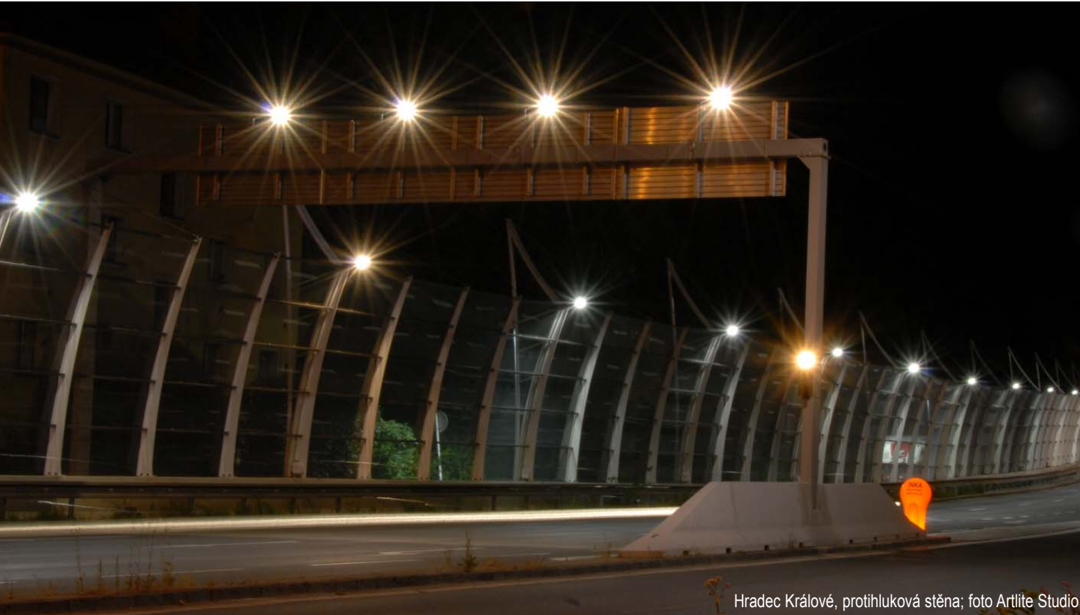
Hradec Králové, protihluková stěna